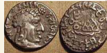
ವಾಸಿಷ್ಠಪುತ್ರ ಸಿರಿ ಸಾತಕಾರ್ಣಿಯ ನಾಣ್ಯಗಳು