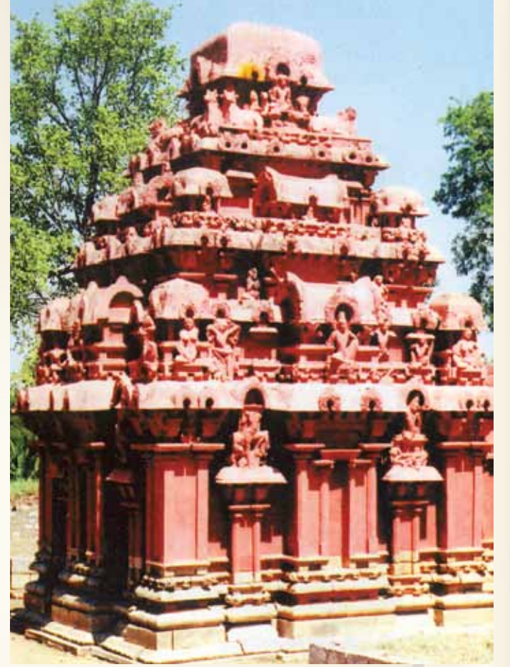
ರಾಮೇಶ್ವರ ದೇವಾಲಯ, ನರಸಮಂಗಲ, ಚಾಮರಾಜನಗರ ಜಿಲ್ಲೆ

ಗಂಗರ ಮತ್ತೊಬ್ಬ ಪ್ರಮುಖ ಅರಸನಾದ ಇಮ್ಮಡಿ ಬೂತುಗನು ರಾಷ್ಟ್ರಕೂಟ ಇಮ್ಮಡಿ ಕೃಷ್ಣನ ಸಾಮಂತನಾಗಿ, ಚೋಳರ ವಿರುದ್ಧದ ಹೋರಾಟದಲ್ಲಿ ಚಕ್ರವರ್ತಿಗೆ ನೆರವಾದನು. ಕ್ರಿ.ಶ ೯೪೯ರಲ್ಲಿ ಜರುಗಿದ ತಕ್ಕೋಲಂ ಯುದ್ಧದಲ್ಲಿ, ಚೋಳ ರಾಜಾಧಿಪತಿಯನ್ನು