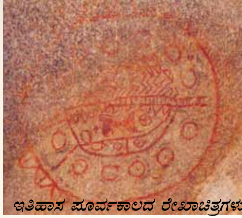
ಇತಿಹಾಸ ಪೂರ್ವಕಾಲದ ರೇಖಾಚಿತ್ರಗಳು

ಅಥವಾ ಅಚ್ಚುಲಿಯನ್ ಸಂಸ್ಕೃತಿಯೆಂದು ಕರೆಯಲಾಗುವ ಪೇಲಿಯೋಲಿಥಿಕ್ ಯುಗದ ಪ್ರಾರಂಭಿಕ ಹಂತವನ್ನು ಪ್ರತಿನಿಧಿಸುತ್ತದೆ. ಕಲ್ಲು ಹಾಗೂ ಸುತ್ತಿಗೆಯ ಆದಿ ವಿಧಾನವನ್ನು ಬಳಸಿ ಮಾಡಿದ ಕೈಗೊಡಲಿ, ಕಡಿಕತ್ತಿ ಹಾಗೂ ಮಚ್ಚುಗಳಂತಹ ಚಕ್ಕೆ ಕಲ್ಲಿನ ಸಲಕರಣೆಗಳ ಬಳಕೆಯು ಈ ಹಂತದ ಹೆಗ್ಗುರುತು. ಈ ಸಲಕರಣೆಗಳನ್ನು ಪ್ರಾಣಿ ಬೇಟೆ, ಮಾಂಸ ಕೊಯ್ಯಲು, ತಿನ್ನಬಹುದಾದ ತೋಡು ಬೇರುಗಳು ಹಾಗೂ ಹಗುರವಾದ ಈಟಿಗಳಂತಹ ಮರದ ಆಯುಧಗಳನ್ನು ತಯಾರಿಸಲು ಬಳಸಲಾಗುತ್ತಿತ್ತು. ಈ