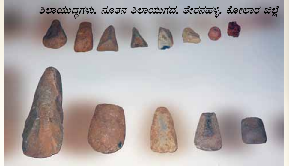
ಶಿಲಾಯುಧಗಳು, ನೂತನ ಶಿಲಾಯುಗದ, ತೇರನಹಳ್ಳಿ, ಕೋಲಾರ ಜಿಲ್ಲೆ

ಮೆಸೋಲಿಥಿಕ್ ಯುಗ: ಅಂತ್ಯ ಶಿಲಾಯುಗದ ನಂತರ ಬಂದ ಮೆಸೋಲಿಥಿಕ್ ಯುಗವು, ಮೈಕ್ರೋಲಿಥ್‌ಗಳೆಂಬ ಅತ್ಯಂತ ಚಿಕ್ಕದಾದ ಕಲ್ಲಿನ ಸಲಕರಣೆಗಳ ಬಳಕೆಯಿಂದ ಗುರುತಿಸಲ್ಪಟ್ಟಿದೆ. ಸಾಮಾನ್ಯ ತ್ರಿಕೋನಾಕಾರ, ಆಯತಾಕಾರ ಹಾಗೂ ಅರ್ಧ-ಚಂದ್ರಾಕಾರದ ರೀತಿಯ ಹಾಗೂ ಜ್ಯಾಮಿತಿಯೇತರ ಅಸ್ವಷ್ಟಾಕಾರವುಳ್ಳ ರೀತಿಗಳೂ ಇದರಲ್ಲಿ ಸೇರ್ಪಡೆಯಾಗಿದೆ. ಸಲಕರಣೆಗಳನ್ನು ತಯಾರಿಸಲು ಕಲ್ಲುಗಳನ್ನು ಬಳಸುವುದು ಮುಂದುವರಿದರೂ, ಶ್ರಮದ ಮಿತವ್ಯಯ ಹಾಗೂ ಹೆಚ್ಚಿನ ಕಾರ್ಯಕ್ಷಮತೆಯನ್ನು ಸಾಧಿಸಲಾಗಿತ್ತು. ಕರ್ನಾಟಕದಲ್ಲಿ, ಈ ಸಾಂಸ್ಕೃತಿಕ ಹಂತವು ರಾಜ್ಯದ ಬಹುತೇಕ ಎಲ್ಲ ಪ್ರದೇಶಗಳಿಂದ ನಿರೂಪಿತವಾಗಿದೆ, ಇದರಲ್ಲಿ ಕೆಲವು ಮುಖ್ಯ ತಾಣಗಳೆಂದರೆ ಕಿಬ್ಬನಹಳ್ಳಿ, ಜಾಲಹಳ್ಳಿ, ಸಂಗನಕಲ್, ಬ್ರಹ್ಮಗಿರಿ, ಇಂಗಳೇಶ್ವರ, ಹಿಂಗೋಳಿ, ಇತ್ಯಾದಿ. ಈ ಸಂಸ್ಕೃತಿಯನ್ನು ಕುರಿತಾಗಿ ಕಲ್ಲಿನ ಸಲಕರಣೆಗಳನ್ನು ಹೊರತುಪಡಿಸಿ ಇತರ ಯಾವುದೇ ವಿವರಗಳು ಲಭ್ಯವಿಲ್ಲದಿದ್ದರೂ, ಜೀವನಕ್ಕಾಗಿ ಬೇಟೆ ಹಾಗೂ ಆಹಾರ ಶೇಖರಣೆ