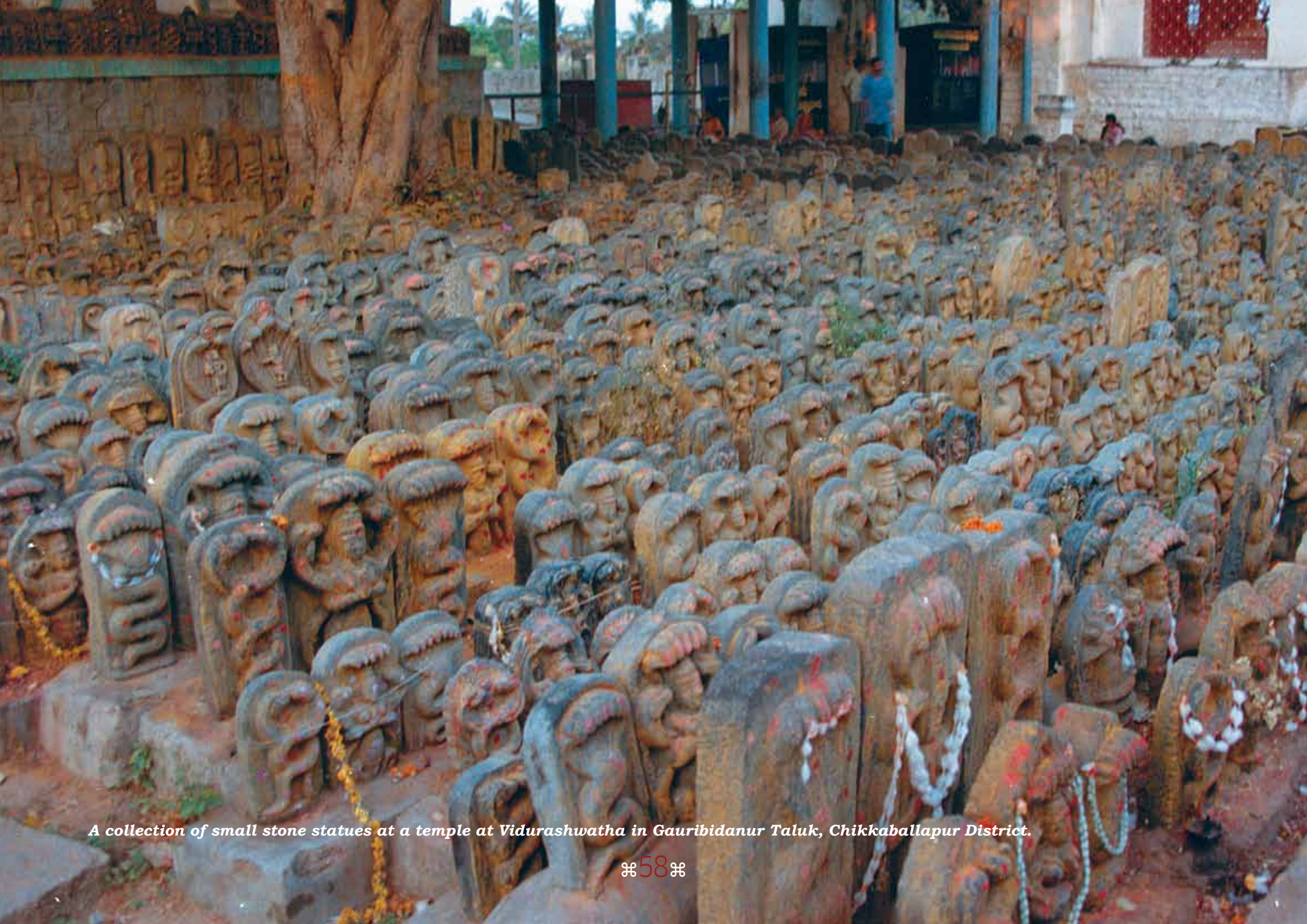
A collection of small stone statues at a temple at Vidurashwatha in Gauribidanur Taluk, Chikkaballapur District.