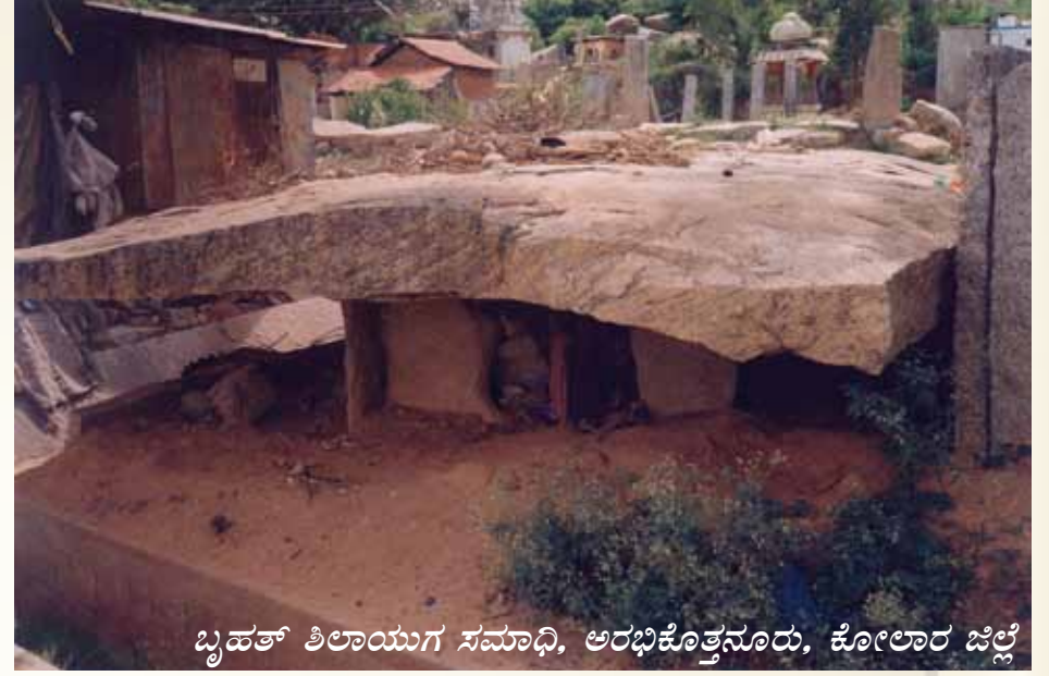
ಬೃಹತ್ ಶಿಲಾಯುಗ ಸಮಾಧಿ, ಅರಬ್ಬಿಕೊತ್ತನೂರು, ಕೋಲಾರ ಜಿಲ್ಲೆ

ಕನ್ನಡ ಜಿಲ್ಲೆಗಳನ್ನು ಹೊರತುಪಡಿಸಿ, ಕರ್ನಾಟಕದ ಬಹುತೇಕ ಎಲ್ಲ ಜಿಲ್ಲೆಗಳಿಂದಲೂ ಇತಿಹಾಸ ಪೂರ್ವ ಕಾಲದ ಅವಶೇಷಗಳು ದೊರೆತಿವೆ.