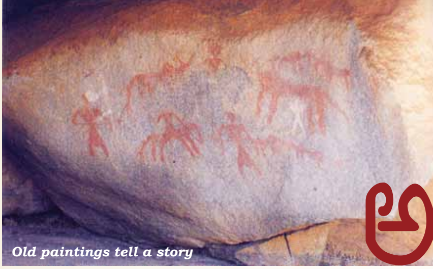
Old paintings tell a story

ಅ ಸಂಖ್ಯಾತ ಇತಿಹಾಸ-ಪೂರ್ವ ಕಾಲದ ಪಳೆಯುಳಿಕೆಗಳು, ಶಾಸನಗಳು, ಸ್ಮಾರಕ ಶಿಲ್ಪಗಳು, ಸ್ಥಳೀಯ ಹಾಗೂ ವಿದೇಶೀ ಸಾಹಿತ್ಯಕ ದಾಖಲೆಗಳು ಕರ್ನಾಟಕದ ಸಿರಿವಂತ ಐತಿಹಾಸಿಕ ಹಾಗೂ ಸಾಂಸ್ಕೃತಿಕ ಪರಂಪರೆಯನ್ನು ಸಾರುತ್ತವೆ.