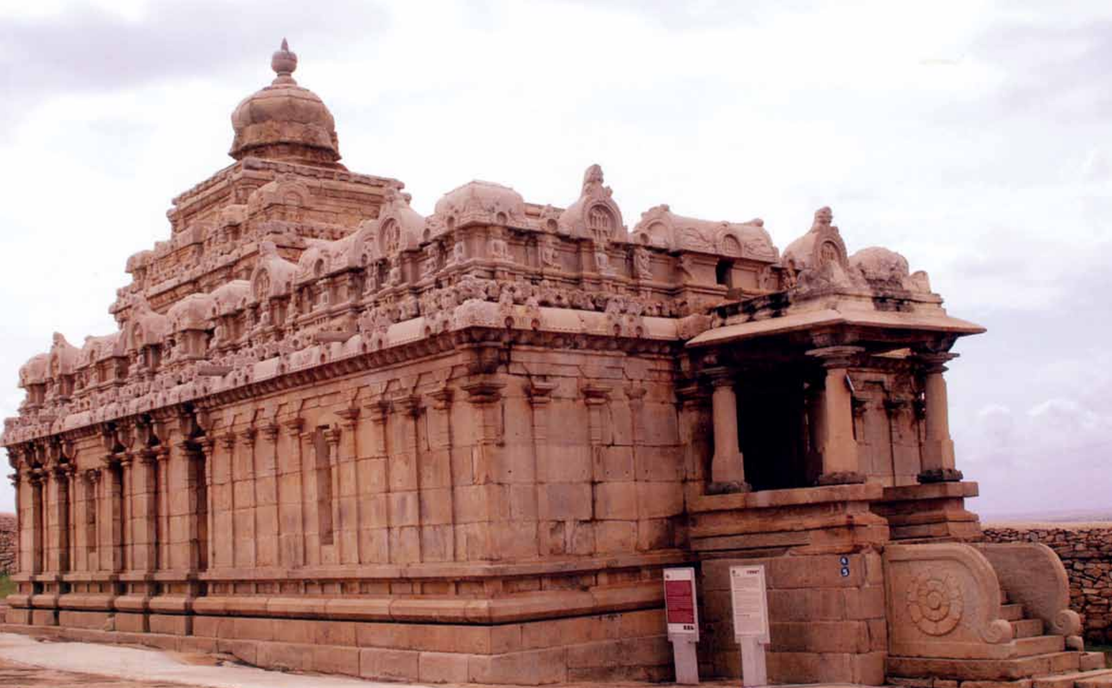
ಚಾವುಂಡರಾಯ ಬಸದಿ, ಶ್ರವಣಬೆಳಗೊಳ, ಹಾಸನ ಜಿಲ್ಲೆ