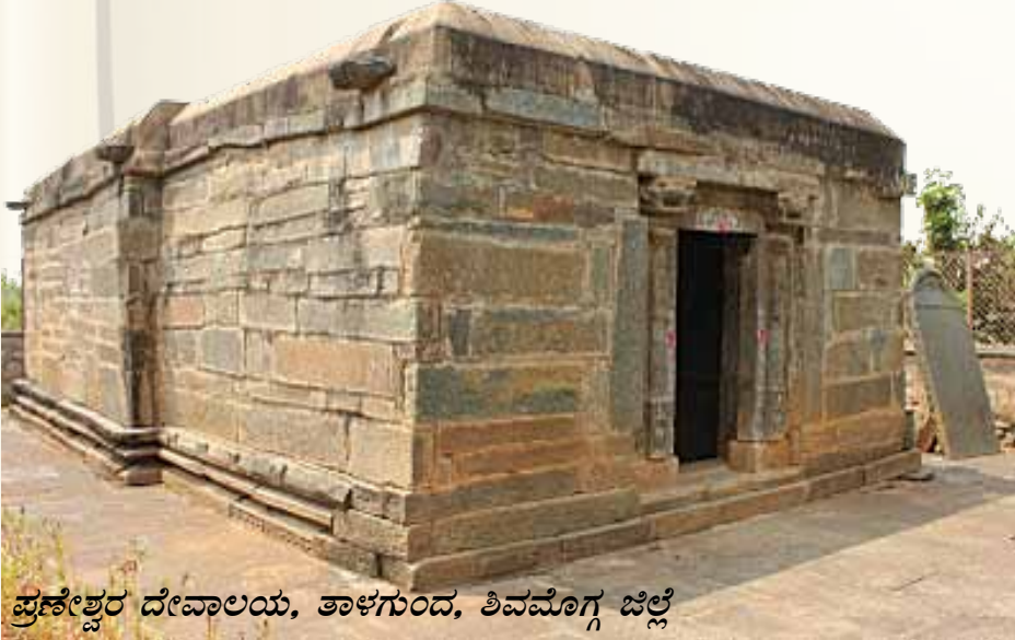
ಪ್ರಣೇಶ್ವರ ದೇವಾಲಯ, ತಾಳಗುಂದ, ಶಿವಮೊಗ್ಗ ಜಿಲ್ಲೆ

ಈ ಮನೆತನದ ಮೊದಲ ಅರಸನಾದ ಮಯೂರವರ್ಮನು ಕದಂಬ ಮನೆತನದ ಮೂಲ ಸ್ಥಾಪಕನಾದ ತ್ರಿಲೋಚನ ಅಥವಾ ಮುಕ್ಕಣ್ಣ ಕದಂಬನ ಮಗನಾಗಿದ್ದು ಮಯೂರನಿಗೆ ಸಂಬಂಧಿಸಿದಂತೆ ಕುತೂಹಲಕಾರಿ ಕಥೆಯೊಂದಿದೆ. ಆ ಪ್ರಕಾರ, ಮೂಲತಃ ಬ್ರಾಹ್ಮಣನಾದ ಮಯೂರನು ಕ್ಷಾತ್ರ ಧರ್ಮವನ್ನು ಸ್ವೀಕರಿಸಿ, ಪಲ್ಲವರನ್ನು ವಿರೋಧಿಸಿ, ಬಲಿಷ್ಠ ರಾಜ್ಯವನ್ನು ಸ್ಥಾಪಿಸಲು ಮುಂದಾದನೆಂಬುದೇ ಆ ಕಥೆಯ ಸಾರವಾಗಿದೆ. ಸುಮಾರು ಐದನೆಯ ಶತಮಾನಕ್ಕೆ ಸೇರಿದ ತಾಳಗುಂದ (ಶಿಕಾರಿಪುರ ತಾ ಶಿವಮೊಗ್ಗ ಜಿಲ್ಲೆ) ಶಿಲಾಶಾಸನದಲ್ಲಿ ದಾಖಲಾಗಿರುವಂತೆ,