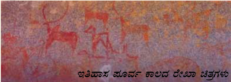
ಇತಿಹಾಸ ಪೂರ್ವ ಕಾಲದ ರೇಖಾ ಚಿತ್ರಗಳು

ಕೃಷ್ಣಾ, ತುಂಗಭದ್ರಾ, ಭೀಮಾ, ಮಲಪ್ರಭಾ ಹಾಗೂ ಘಟಪ್ರಭಾ ನದಿ ದಡಗಳ ಅನೇಕ ತಾಣಗಳಲ್ಲಿ ಪ್ರಾರಂಭಿಕ ಪೇಲಿಯೋಲಿಥಿಕ್ ಸಲಕರಣೆಗಳು ಬಹಳಷ್ಟು ಸಂಖ್ಯೆಯಲ್ಲಿ ದೊರೆತಿವೆ. ಉತ್ತರ ಕರ್ನಾಟಕದ ನದೀ ಕಣಿವೆಗಳಲ್ಲಿ ಇರುವ ಇತರ ಪ್ರಮುಖ ತಾಣಗಳೆಂದರೆ ಹುಣಸಗಿ, ಗುಳ್ಬಾಲ್, ಕಲ್ಲೇವನಹಳ್ಳಿ, ತೆಗ್ಗಿನಹಳ್ಳಿ, ನಿಟ್ಟೂರು, ಅನಗವಾಡಿ ಹಾಗೂ ಖ್ಯಾಡ್. ತುಮಕೂರು ಜಿಲ್ಲೆಯಲ್ಲಿರುವ ಕಿಬ್ಬನಹಳ್ಳಿಯೂ ಇತಿಹಾಸ-ಪೂರ್ವ ಯುಗದ ಅದೇ ರೀತಿಯ ಸಲಕರಣೆಗಳು ದೊರೆತ ಮತ್ತೊಂದು ಪ್ರದೇಶ. ಕೋಲಾರ, ಚಾಮರಾಜನಗರ, ಕೊಡಗು, ಉಡುಪಿ ಹಾಗೂ ಉತ್ತರ